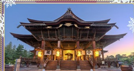
วัดเซ็นโคจิ นากาโนะ