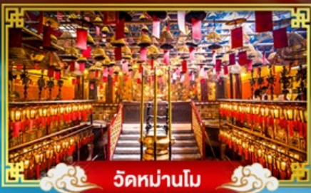
วัดม่านโม

พักกลางวัน "ริมพารู๋" บินรดลองเทศกาลปีใหม่ ณ เกาะฮ่องกง