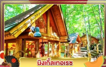
นิงเกิ้ลทอเรซ

ชมทุ่งลาเวนเดอร์ และทุ่งดอกไม้ขึ้นชื่อของฮอกไกโด ฟาร์มโทมิตะ และ ชิโกะไซโนะโอะกะ