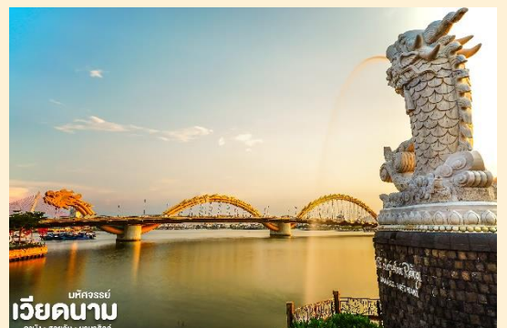
เวียดนาม ดานัง • โฮอัน • บานาฮิลล์

จากนั้น นำท่านชม สะพานมังกร Dragon Bridge อีกหนึ่งที่ยี่หวดานังแห่งใหม่สะพานมังกรไฟสัญลักษณ์ความสำเร็จแห่งใหม่ของเวียดนาม ที่มีความยาว 666 เมตร ความกว้างเท่าถนน 6 เลนส์ เชื่อมต่อสองฟากฝั่งของแม่น้ำฮันประเทศเวียดนามสะพานมังกรถูกสร้างขึ้นเพื่อเป็นแหล่งท่องเที่ยวดานัง เป็นสัญลักษณ์ของการฟื้นคืนประเทศ และเป็นการฟื้นฟูเศรษฐกิจของประเทศ โดยได้เปิดใช้งานตั้งแต่ปี 2013 ด้วยสถาปัตยกรรมที่บวักกับเทคโนโลยีสมัยใหม่ที่ได้รับแรงบันดาลใจจากตำนานของเวียดนามเมื่อกว่าหนึ่งพันปีมาแล้ว