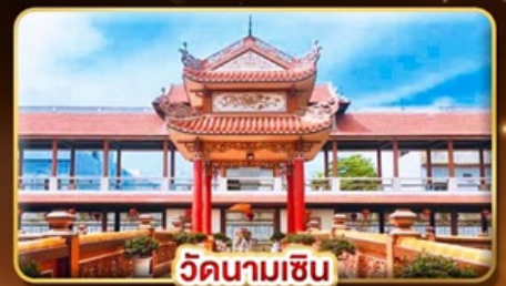
เวียดนามเซ็น