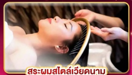
สระम्मสไตล์เวียดนาม