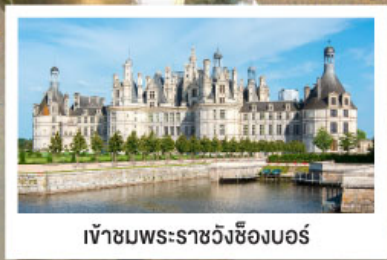
เข้าชมพระราชวังซ็องบอร์