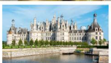
เข้าชมพระราชวังซ็องบอร์