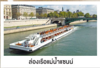
ล่องเรือแม่น้ำเซนน์