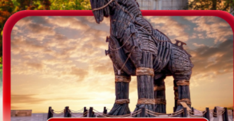
ม้าไม้แห่งทรอย