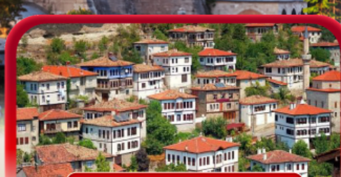
เมืองมรดกโลกซาฟรานโบลู