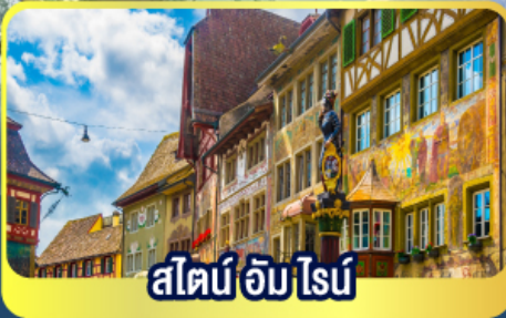
สไตน์ อัม ไนน์