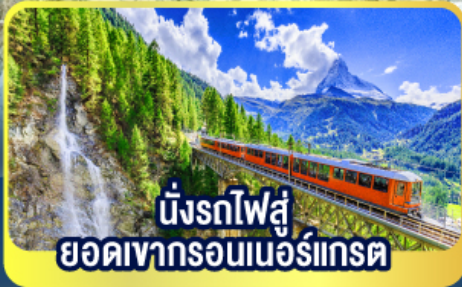
นั่งรถไฟสู่ ยอดเขารอนเนอร์เกรต