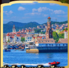
ท่าเรือประมงต้าเหลียน