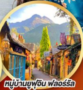
หมู่บ้านยูฟูอิน ฟลอร์ริล