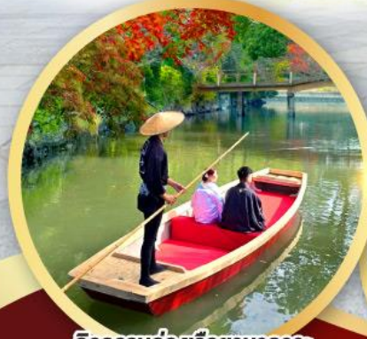
กิจกรรมล่องเรือยามากาวะ