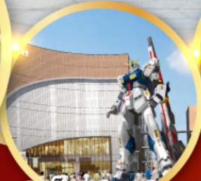
กินดื่ม ปาร์ค ฟุกุโอกะ