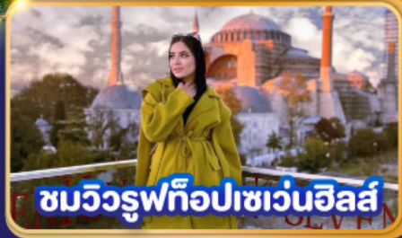
ชมวิวยุททือปเซเวนฮิลส์