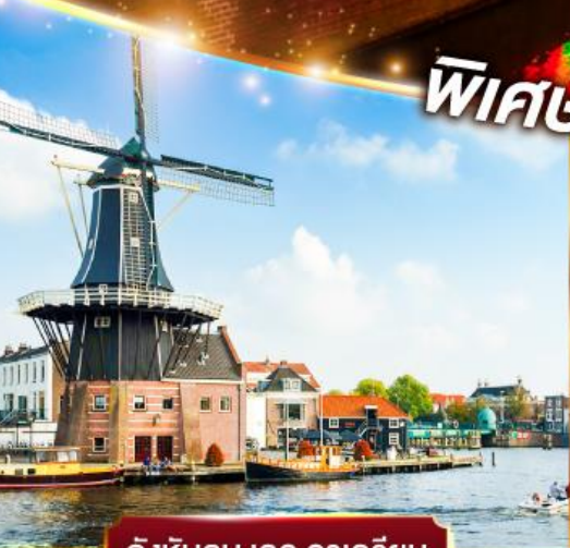
กังหันลม เดอ อาครีเยน