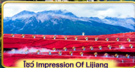
โชว์ Impression Of Lijiang