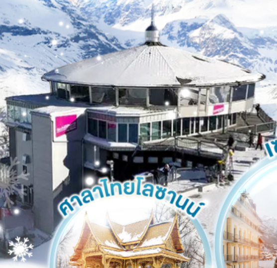
ศาลาไทยโลซานน์