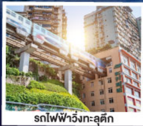
รถไฟฟ้าวิ่งทะลุคิก