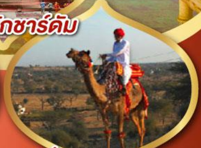
ฟรี ขี่อูฐ เมืองมันทอวา ราคาเริ่มต้น