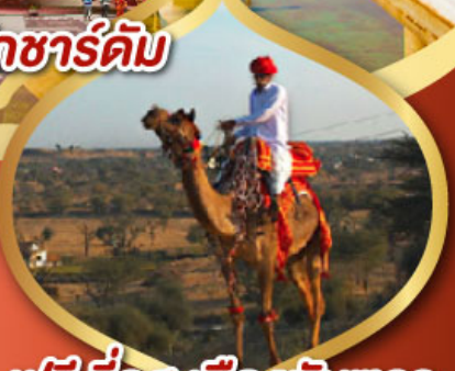
ฟรี ขี่อูฐ เมืองมันทวา ราคาเริ่มต้น