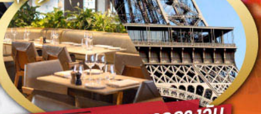
รับประทานอาหารกลางวัน บนหอไอเฟล

ไฮไลท์ในโปรแกรม • ถ่ายรูปคู่มือไอเฟลและพิพิธภัณฑ์ลูฟว์ • สะพานไม้ชาเปล ลูเซิร์น • ขึ้นกระเช้าสู่ยอดเขาจุงเฟรา • เมืองมรดกโลก กรุงเบิร์น • ถ่ายรูปปราสาทชิลยองที่มงเทรอร์ซ • ศาลาไทย เมืองโลซานน์ • เดินเพลินๆ ณ เมืองเวเวย์