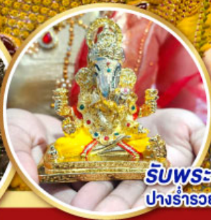
รับพระพิฆเนศวร ปางรำรอย ท่านละ 1 องค์