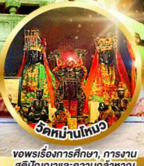
วัดหม่านโหมว ขอพรเรื่องการศึกษา, การงาน สติปัญญาและความกล้าหาญ