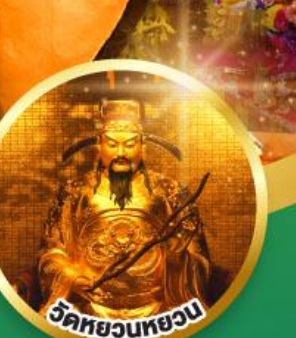
วัดหยวนหยวน ขอพรเรื่องสุขภาพ, โชคลาภ ความสำเร็จก้าวหน้า

เมนูพิเศษ! ต้มซ่าฮ่องกง, บุฟเฟต์ซาบูสโตล์ฮ่องกง, ห่านย่าง