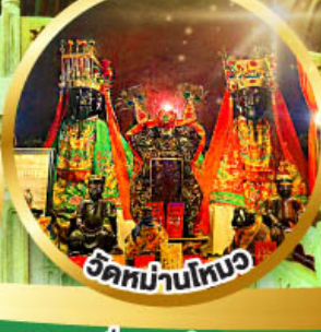
วัดบ้านโพนว

ขอพรเรื่องการศึกษา, การงาน สติปัญญาและความกล้าหาญ