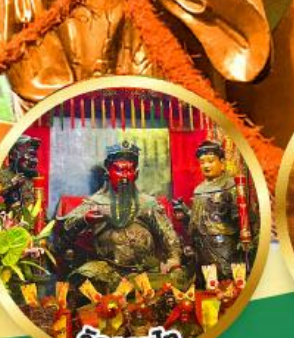
วัดกวนโก ขอพรเทพเจ้ากวนอู เงินทอง, ธุรกิจมั่นคง