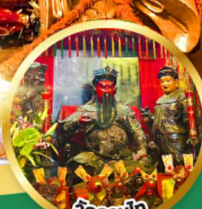
วัดกวนโก