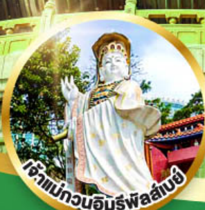
เจ้าแม่กวนอิมรับพลังบึ้ง