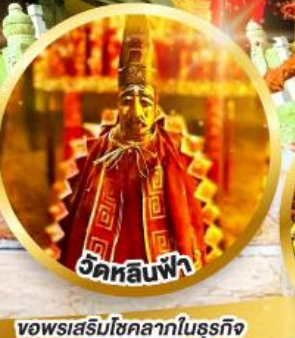
วัดหลินฟ้า ขอพรเสริมโชคลาภในธุรกิจ และการเงิน