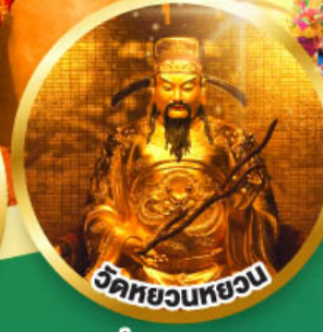
วัดหยวนหยวน

ขอพรเรื่องสุขภาพ, โชคลาภ ความเจริญก้าวหน้า