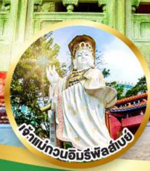
เจ้าแม่กวนอิมรัฟลัดโบย ขอพรรับพลังงานดี เสริมพลังดวงคู่