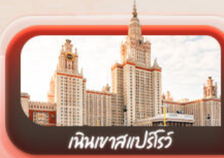
เนินเขาสเปร์ไร