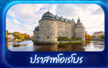
ปราสาทไอเรโบ