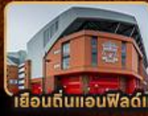
เยือนต้นแอนฟิลด์และโอลด์แทรฟฟอร์ด

London Stonehenge Liverpool Manchester Stratford Upon Avon