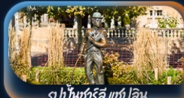
รูปปั้นชาร์ลี แชปลิน