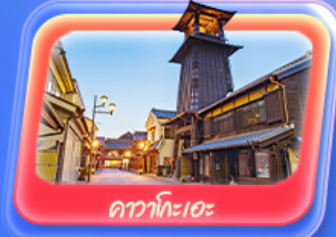
คาวาโกเอะ