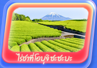
ไร่ชาที่โอบุจิ ชะชะปะ

Highlight สัมผัสความเป็นญี่ปุ่น ชมวิวฟูจิที่ ทะเลสาบยามานากะโกะ ศาลเจ้าฟูจิซังเซนเทน "Unseen" ขอบพระด้วยหิวโซเท้า ที่วัดมัตสึชิม่า โซเดิน ถ่ายภาพวิวไร่ชาที่ โอบุจิ ชะชะปะ ขอบพระ วัดอาซากุสะ วัดพระใหญ่อุซึคุ โดบุทสึ เดินเล่น คาวาโกเอะ Toyosu Senkyaku Banrai ซุปปิ้งย่านชินจูกุ และห้างไดเวอร์ซิตี