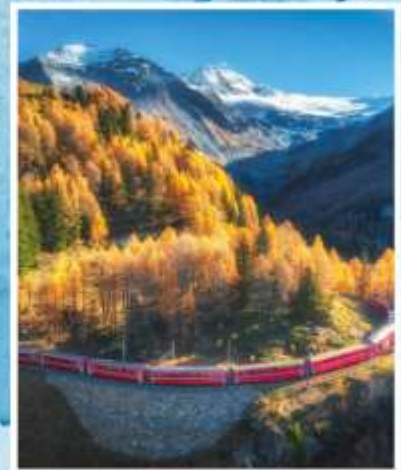
BERNINA EXPRESS Unesco

ออกเดินทาง 22-30 ต.ค. / 31 ต.ค.-08 พ.ย. 69