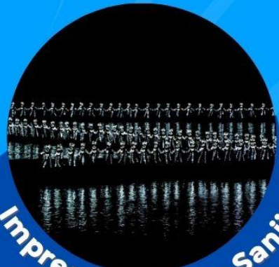
Impression of Liu Sanjie