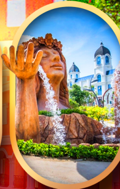
น้ำตกเทพพิหญิง