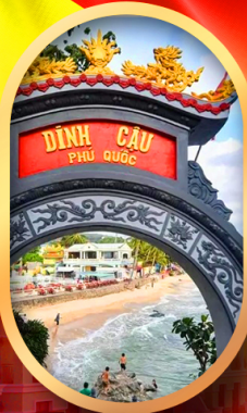
ศาลเจ้าติงเกา