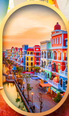
เอนิเมะแห่งเวียดนาม