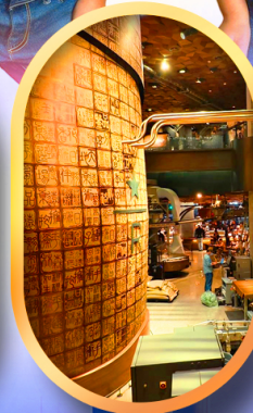
ร้านสตาร์บัคส์