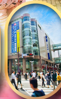
ช้อปปิ้งย่านเท็นจิน