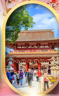
ศาลเจ้าดาไซฟู