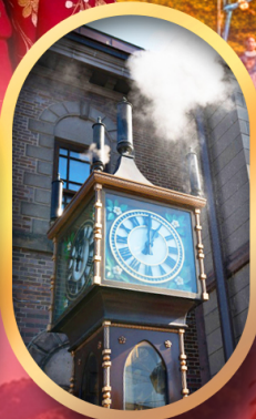
พิพิธภัณฑ์ถ้ำกลองดนตรี