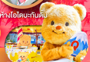
Fuji q Highland x Butterbear เดินทาง พ.ค. 69 เป็นต้นไป