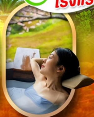
แช่บ่อออนเซ็นญี่ปุ่น