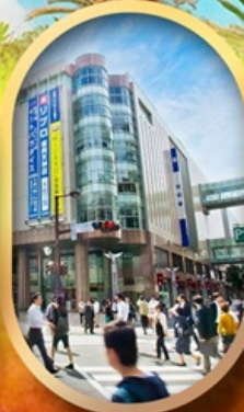
ช้อปปิ้งย่านเกินจิน