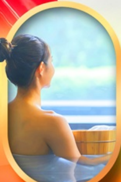
พักรูแรมออนเซ็น