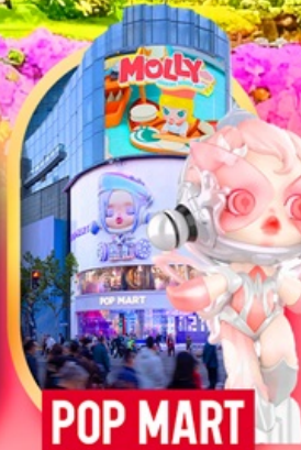
ช้อปปิ้งถนนหนางจิง