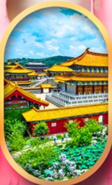
เมืองจำลองสามก๊ก