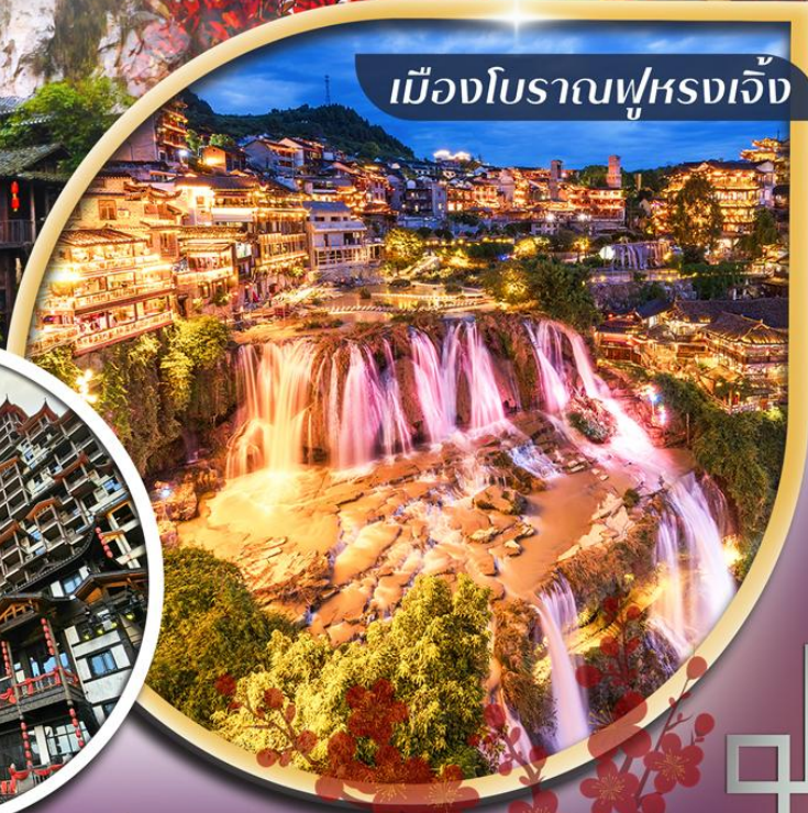
เมืองโบราณฟูหลงเจิ้ง

คอนเฟิร์มออกเดินทาง ตั้งแต่ 10 ท่าน ขึ้นไป