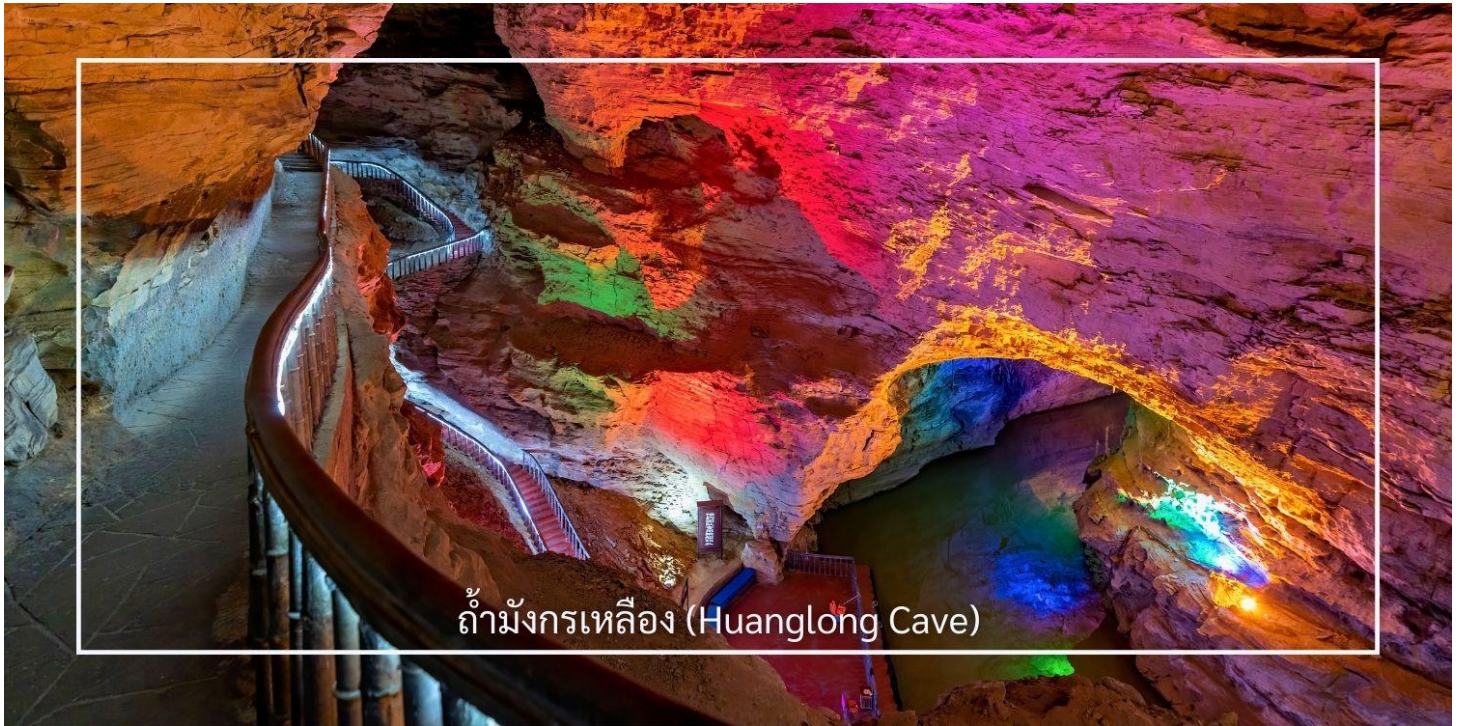
ถ้ำมังกรเหลือง (Huanglong Cave)

ถ้ำมังกรเหลือง หนึ่งในถ้ำหินงอกหินย้อยที่ยิ่งใหญ่และงดงามที่สุดของเมืองจางเจี๋ย แหล่งท่องเที่ยวทางธรรมชาติที่ได้รับการยกย่องว่าเป็น “พระราชวังใต้พิภพ” แห่งดินแดนอุ่หลิงหยวน ถ้ำแห่งนี้มีโครงสร้างขนาดใหญ่ แบ่งออกเป็น 4 ชั้น ภายในประกอบด้วยห้องโถงกว้างใหญ่ ลำธารใต้ดิน บึงธรรมชาติ และแนวระเบียงหินที่ทอดยาวอย่างน่าตื่นตา ความมหัศจรรย์ของหินงอกหินย้อยซึ่งก่อตัวสะสมมาเป็นเวลาหลายล้านปี ได้รับการจัดแสงอย่างสวยงาม ช่วยขับเน้นรูปร่างแปลกตาให้โดดเด่น ราวงานศิลป์จากธรรมชาติ สัมผัสประสบการณ์ ล่องเรือชมแสงสีภายในถ้ำ โดยเรือจะนำท่านลัดเลาะไปตามสายน้ำใต้ถ้ำให้ท่านได้สัมผัสกับความยิ่งใหญ่ของธรรมชาติอันน่าอัศจรรย์ได้อย่างใกล้ชิด