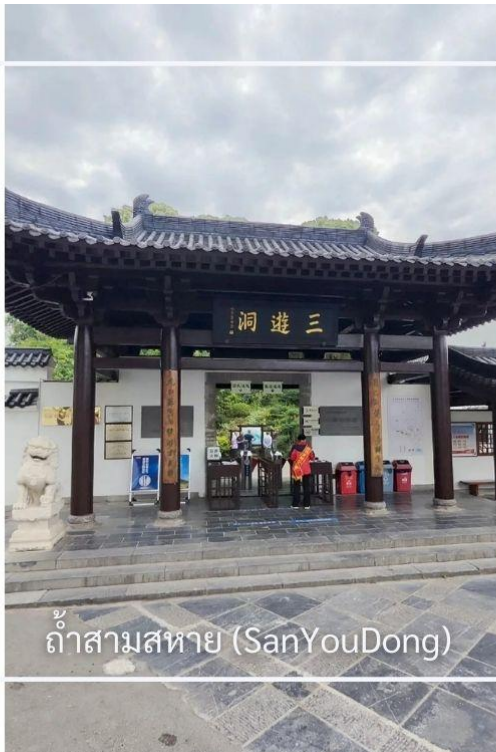
ถ้าสามสหาย (SanYouDong)