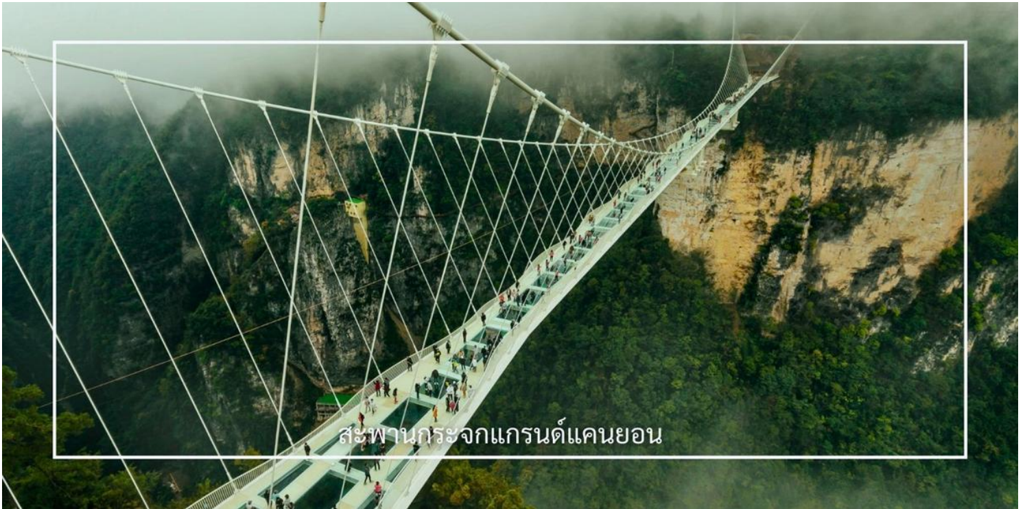
สะพานกระจกแกรนด์แคนยอน