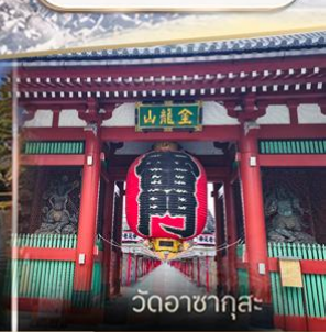
วัดวาทากุสะ