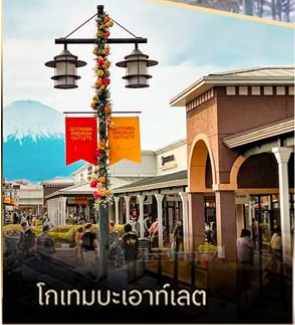
โทเกมมะเอาก์เล็ด