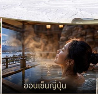
ออนเซ็นญี่ปุ่น