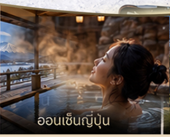
ออนเซ็นญี่ปุ่น