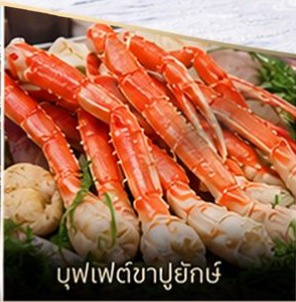
บุฟเฟต์ซาปูยักษ์