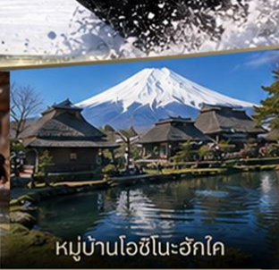
หมู่บ้านโอชิโนะอักษโค