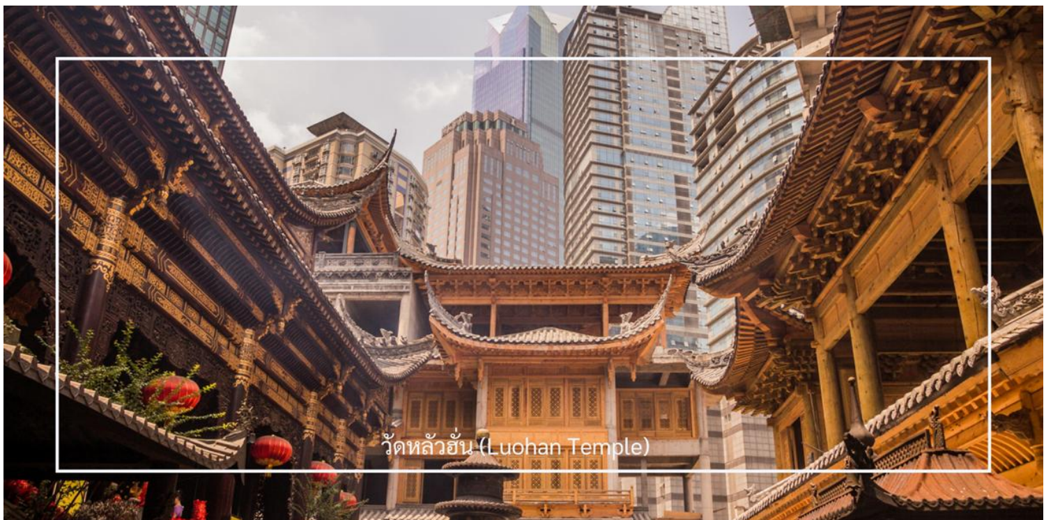
วัดหลัวฮั่น (Luohan Temple)

นำท่านเที่ยวชม วัดหลัวฮั่น (Luohan Temple) หรือที่เรียกว่า "วัดอรหันต์" เป็นวัดที่มีชื่อเสียงในเมืองฉิ่ง (Chongqing) มีประวัติศาสตร์ยาวนานและมีความสำคัญในด้านศาสนาพุทธ วัดหลัวฮั่นมีพระพุทธรูปและรูปปั้นอรหันต์จำนวนมาก ซึ่งเป็นที่เคารพนับถือของผู้มาเยือน นอกจากนี้ยังมีบริเวณที่ให้ผู้เข้าชมสามารถทำบุญและสวดมนต์