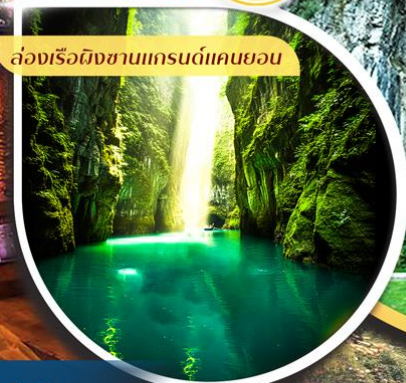
ล่องเรือผิงซานแกรนด์แคนยอน

คอนเฟิร์มออกเดินทาง ตั้งแต่ 10 วัน ขึ้นไป