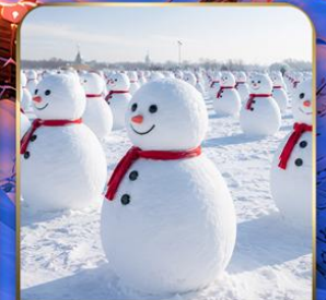
สวนตุ๊กตาหิมะ