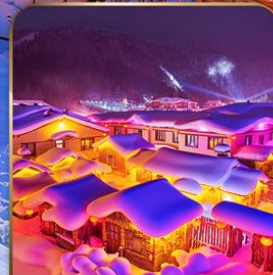
หมู่บ้าน DREAM HOME