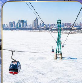
นั่งกระเช้าไฟฟ้า HARBIN ROPEWAY