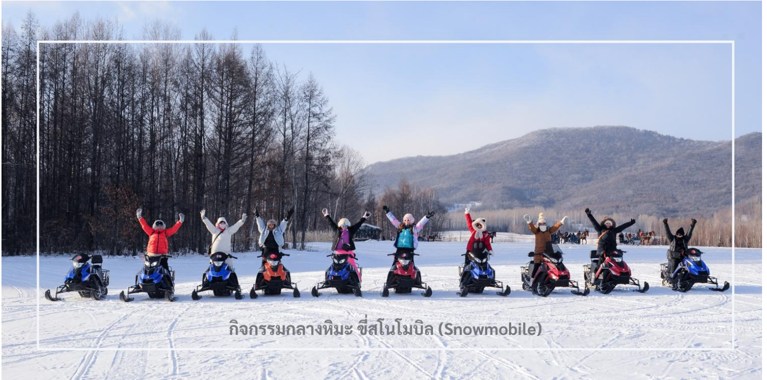
กิจกรรมกลางหิมะ ซีสโนโมบิล (Snowmobile)

สนุกสนานกับอีกหนึ่งกิจกรรมยอดนิยมของฤดูหนาว นั่นคือ การขับสโนว์โมบิล (Snowmobile ) สัมผัสความตื่นเต้นเร้าใจ กับการขับเคลื่อนผ่านหิมะอันกว้างใหญ่ ท่ามกลางบรรยากาศของภูเขาและป่าสนที่ปกคลุมด้วยหิมะขาวราวกับเทพนิยาย อีกหนึ่งกิจกรรมสุดมันส์ที่ไม่ควรพลาดในการผจญภัยท่ามกลางฤดูหนาวของเมืองหนาวสุดขีด (รวมค่ากิจกรรม ใช้เวลาประมาณ 20-30 นาที)