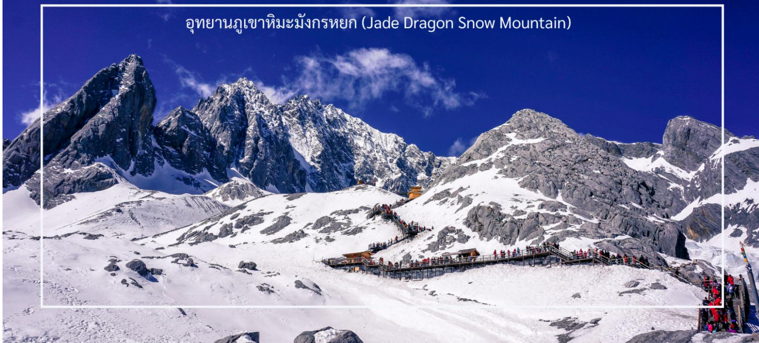
อุทยานภูเขาหิมะมังกรหยก (Jade Dragon Snow Mountain)

การท่องเที่ยวบริเวณภูเขาหิมะมังกรหยกนั้น ถือเป็นจุดที่มีออกซิเจน ที่เบาบางมาก รวมไปถึงระดับความสูง ที่มีอากาศหนาวเย็นและลมแรง ควรเตรียมร่างกายของท่านให้พร้อม และปฏิบัติตามคำแนะนำของไกด์ท้องถิ่น และหัวหน้าทัวร์อย่างเคร่งครัด และควรมีกระป๋องออกซิเจนแบบพกพา เพื่อช่วยเหลือนักเดินทาง ในกรณีที่ท่านมีอาการแพ้ความสูงแบบเฉียบพลัน (หมายเหตุ: กรณีที่มีการประกาศปิดให้บริการกระเช้าไฟฟ้า อันเนื่องมาจากเหตุผลด้านสภาพอากาศไม่เอื้ออำนวย, การปิดซ่อมบำรุง, หรือเหตุผลใดๆ บริษัทผู้จัดขอสงวนสิทธิ์ในการปรับเปลี่ยนโปรแกรมท่องเที่ยวอื่นทดแทน หรือในกรณีที่กระเช้าใหญ่ปิด ทางบริษัทผู้จัด จะเปลี่ยนมาขึ้นกระเช้าเล็กยูนชันผิงแทน โดยไม่ต้องแจ้งให้ทราบล่วงหน้า)