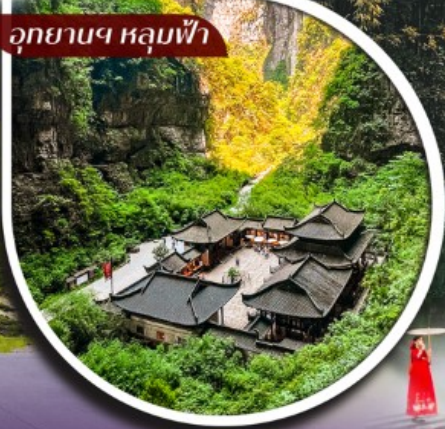
อุทยานฯ หลุมฟ้า