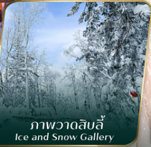
ภาพวาดสิบลี้ Ice and Snow Gallery

คอนเฟิร์มออกเดินทาง ตั้งแต่ 15 วัน ขึ้นไป