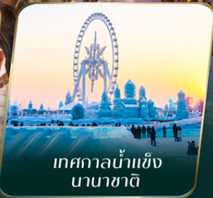
เทศกาลน้ำแข็ง นานาชาติ