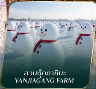
สวนตุ๊กตาหิมะ YANJIAGANG FARM