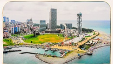
เมืองชายทะเล บาดูมี