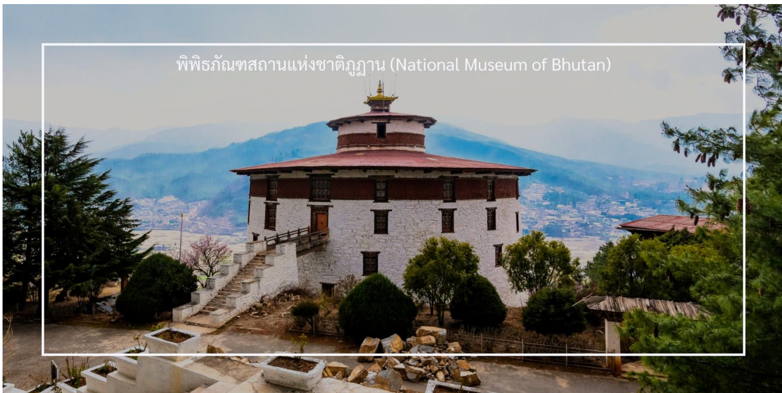
พิพิธภัณฑ์สถานแห่งชาติภูฏาน (National Museum of Bhutan)

เที่ยวชม พาโรซอง (Paro Dzong) เป็นหนึ่งในสถาปัตยกรรมที่สำคัญและสวยงามที่สุดในภูฏาน ตั้งอยู่ในเมืองพาโร (Paro) และมีบทบาทสำคัญทั้งในด้านศาสนาและการปกครอง สร้างขึ้นในปี 1646 เพื่อใช้เป็นที่ทำการของรัฐบาลและวัดประจำเมือง พาโรซองเป็นสัญลักษณ์ของความเข้มแข็งและความเป็นอิสระของภูฏาน