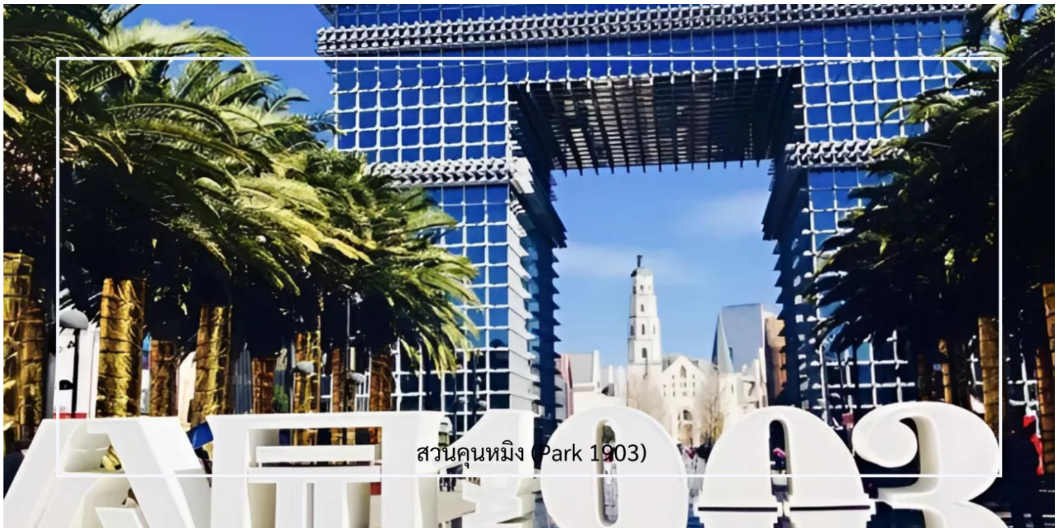
สวนคunหมีง (Park 1903)

จากนั้นนำท่าน ชมสวนคunหมีง (Park 1903) เป็นสวนสาธารณะ เหมาะสำหรับการพักผ่อนและเพลิดเพลินกับธรรมชาติ สวนแห่งนี้มีพื้นที่กว้างขวาง มีเส้นทางเดินเล่น สนามหญ้า และพื้นที่สำหรับกิจกรรมต่างๆ นอกจากนี้ยังมีต้นไม้และดอกไม้ที่หลากหลาย ทำให้สวนมีบรรยากาศสดชื่นและสงบเงียบ