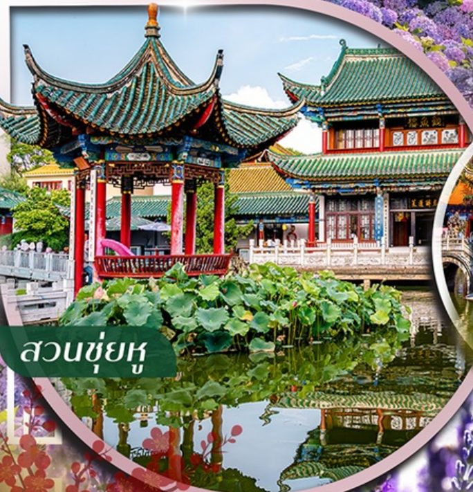
สวนชู่ฮู่