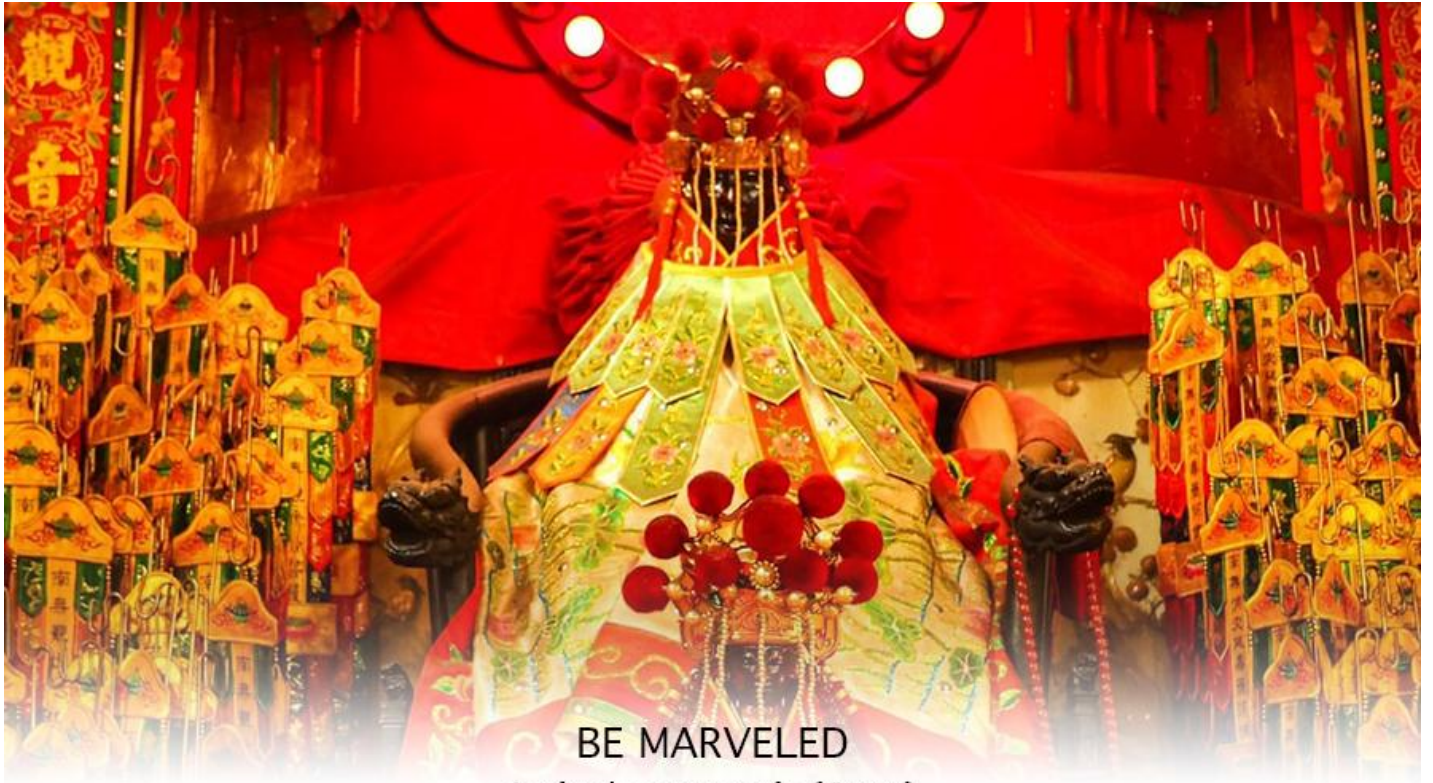
BE MARVELED วัดเจ้าแม่กวนอิมฮวงอ้า (ยิมวิน)

หรือ วันเปิดทรัพย์ เป็นความเชื่อของคนเชื้อสายจีน ทั้งฝั่งฮ่องกง และมาเก๊าถือเป็นพิธีศักดิ์สิทธิ์ในการขอพรเจ้าแม่กวนอิม เชื่อกันว่าเป็นการไหว้และการทำพิธีที่ช่วยเสริมดวงให้เงินทองไหลมาเทมา การขอยืมเงินองค์กวนอิม ที่ขึ้นชื่อเรื่องความเมตตา หรือทำการค้า เปิดธุรกิจค้าขายเจริญรุ่งเรือง