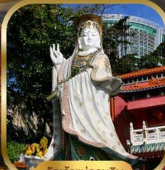
วัดเจ้าแม่กวนอิม สวีตเดีย