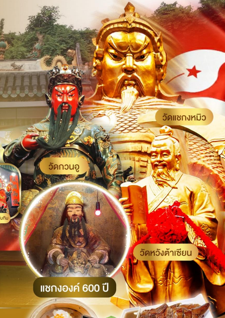
วัดเซกงหมิว