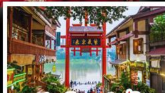
หมู่บ้านโบราณฉือซีโจว