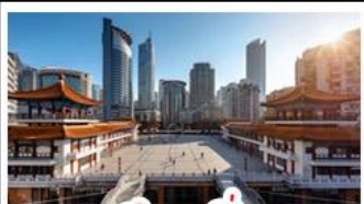
ตึกขุยซิ่ง

พระแกะสลักหินต้าจู้ - หลุมฟ้าสะพานสวรรค์ - เจนางฟ้า ตึกขุยซิ่ง - ตึกตะเกียบ - หมู่บ้านโบราณฉือซีโจว