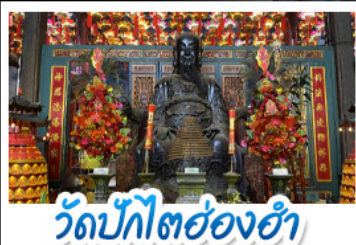
วัดปักไต้ฮ่องกง