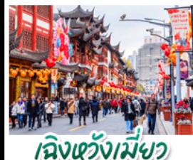
เมืองเซี่ยงเหมียว